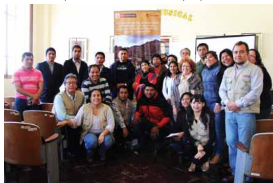
Grupo de investigadores de ambos países

Los integrantes de la Comitiva de Iquique, relataron que en Perú, el Qhapaq Ñan, es un