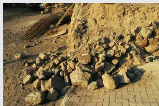
Desprendimiento de rocas por las calles de Miñe Miñe