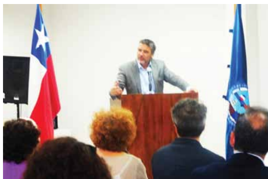
Senador Fulvio Rossi en palabras iniciales del evento