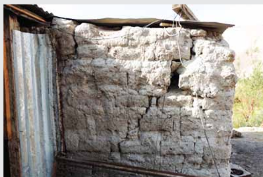
Destrucción en muros de adobe de viviendas en Aroma