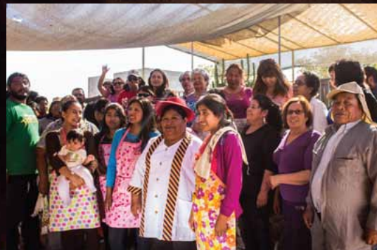
Grupo de participantes al finalizar las jornadas