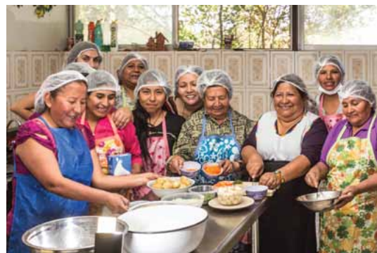
Los sabores típicos fueron los protagonistas en el Taller de Gastronomía