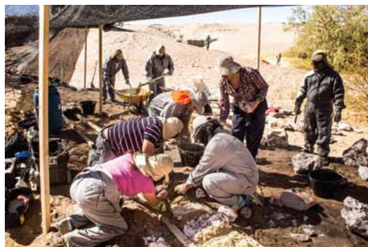
El Taller de Prácticas Constructivas trabajando en conjunto