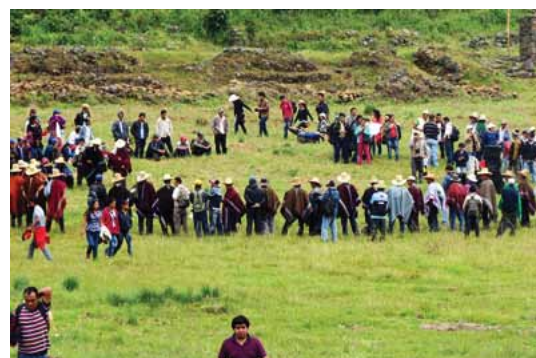
Rondas Campesinas reunidas en Aytape