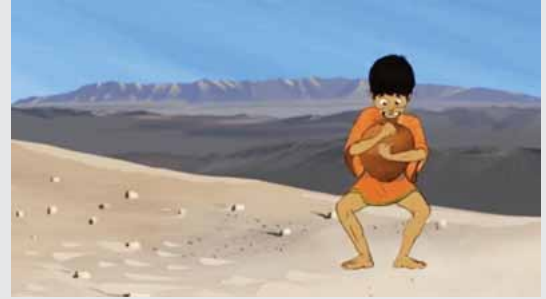
Fotograma de la realización audiovisual