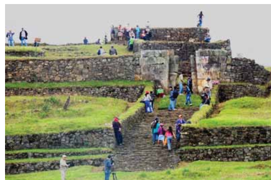
Visita a las ruinas de Aytape