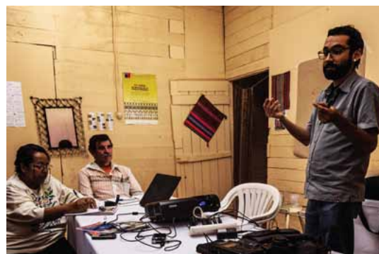
El Taller de Registro Documental generó proyectos en cada uno de los participantes