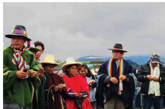
Ceremonia y celebratorio espiritual al cultivo